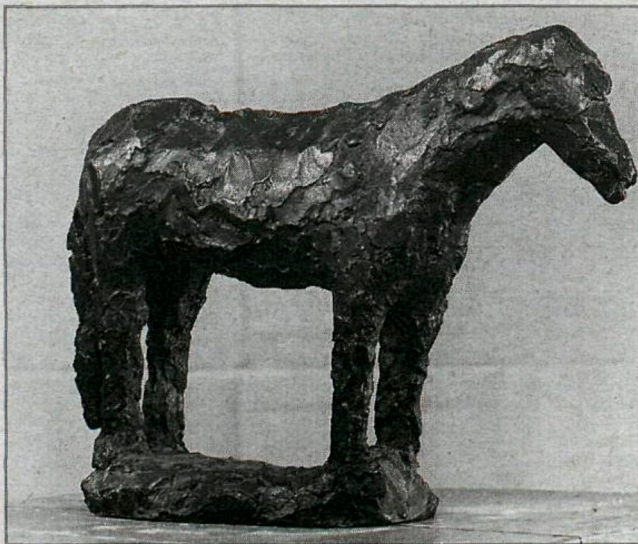
ÚTIGANGSHESTUR. Í eigu Norræna Hússins.